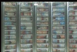
側方カメラ [ズームなし]