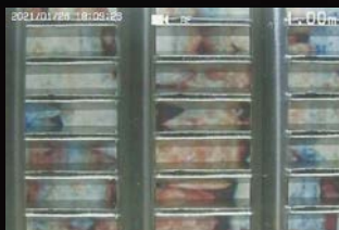
側方カメラ [ズームあり]